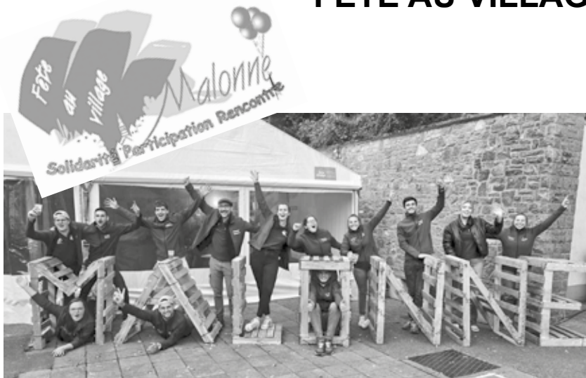
Le comité FAV

Quelle belle ambiance il y a eu ce samedi 5 octobre pour la Fête au Village dans la cour de l'Institut Saint-Berthuin. Le Comité super motivé (qui s'est renforcé) était à pied d'œuvre dès le matin pour être en mesure d'accueillir les participants aux jeux inter quartiers de l'après-midi où petits et grands ont rivalisé d'adresse, de vitesse et de stratégie pour faire gagner leur quartier. Finalement, ce sont les quartiers Fond de Malonne, Clinchamp, Les Trés, Bransart-Marlières, Terre à l'Îpe et Vecquée qui ont tiré leur épingle du jeu.