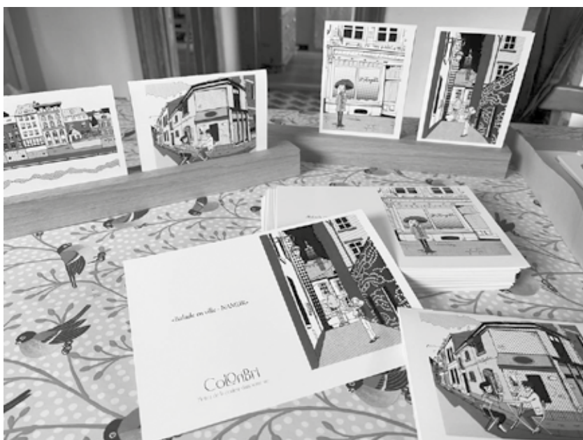
Cartes pour les Balades à Namur

Ses projets actuels sont de revenir à certains procédés d'impression à l'ancienne comme la sérigraphie pour les utiliser aussi bien chez Handipar que dans ses projets plus personnels. Chez Sophie, hobbies et travail sont indissociables !