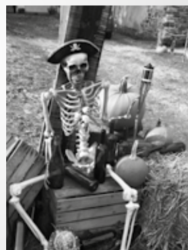
Halloween à Malonne, un peu partout !