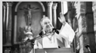
Le sermon des Wallonies (p.2)