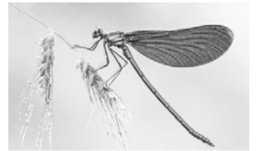
Fable de Rd