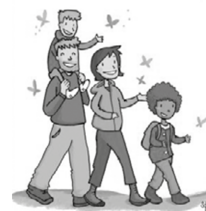
dessin réalisé pour la marche ADEPS de l'école Saint-Joseph