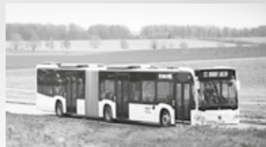
Trajets et horaires des bus (pp.4 & 5)